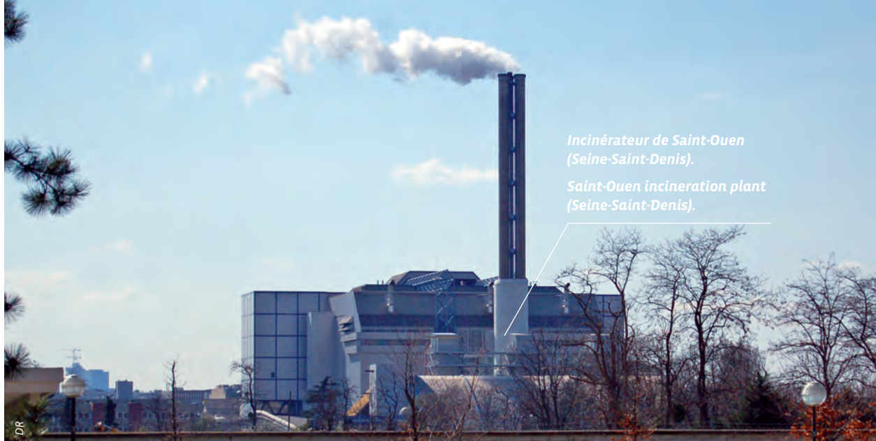
Incinérateur de Saint-Ouen (Seine-Saint-Denis).