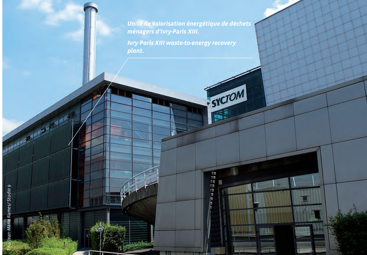
Unité de valorisation énergétique de déchets ménagers d'Ivry-Paris XIII.