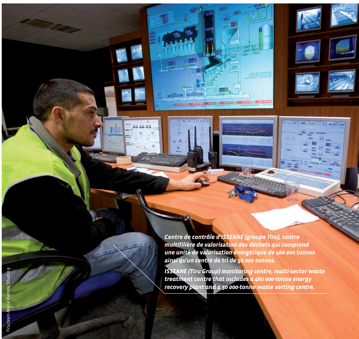
Centre de contrôle d'ISSEANE (groupe Tiru), centre multifilière de valorisation des déchets qui comprend une unité de valorisation énergétique de 460 000 tonnes ainsi qu'un centre de tri de 50 000 tonnes.

ISSEANE (Tiru Group) monitoring centre, multi-sector waste treatment centre that includes a 460 000-tonne energy recovery plant and a 50 000-tonne waste sorting centre.